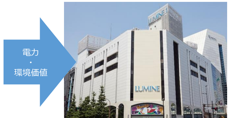
供給先：ルミネ新宿

※1 環境価値証書について（環境省ホームページ http://www.env.go.jp 参照）